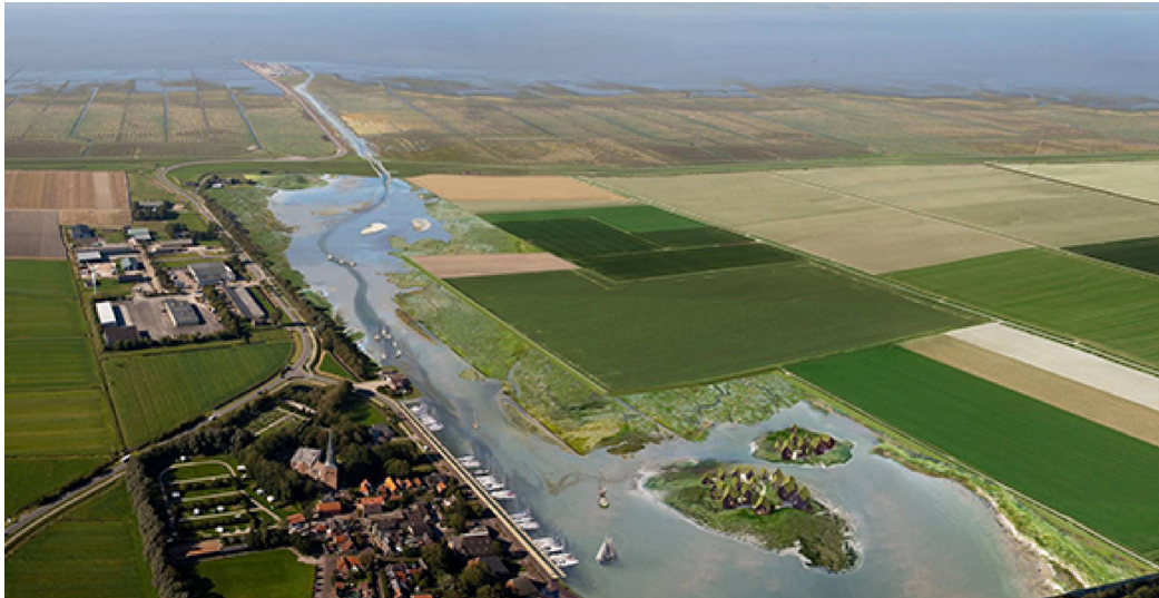
Impressie van Holwerd aan Zee

webcambeelden waar nachttactievedieren gespot kunnen worden. Het Waddenfonds draagt 1,5 miljoen bij aan het project dat in totaal 3 miljoen kost. Lees meer